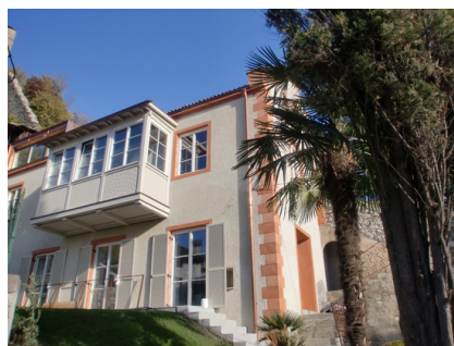
Thermische Sanierung mit RÖFIX CalceClima Thermo, Meran, Italien