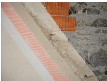
Systemaufbau des mineralischen Dämmputzsystemes RÖFIX CalceClima Thermo